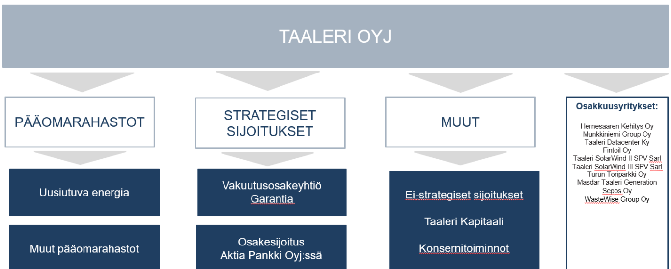
Kuva 1: Taaleri-konsernin rakenne 31.12.2023

Taaleri Oyj tytär- ja osakkuusyhtiöineen muodostaa vakuutusyhtiölain 26 luvun mukaisen vakuutusyhtyröhmän, johon sovelletaan ryhmävalvontaa. Ryhmän emoyhteisönä toimii Taaleri Oyj. Vakuutusyhtyröhmälle ei ole asetettu vakava-raisuuspääomavaatimusta.