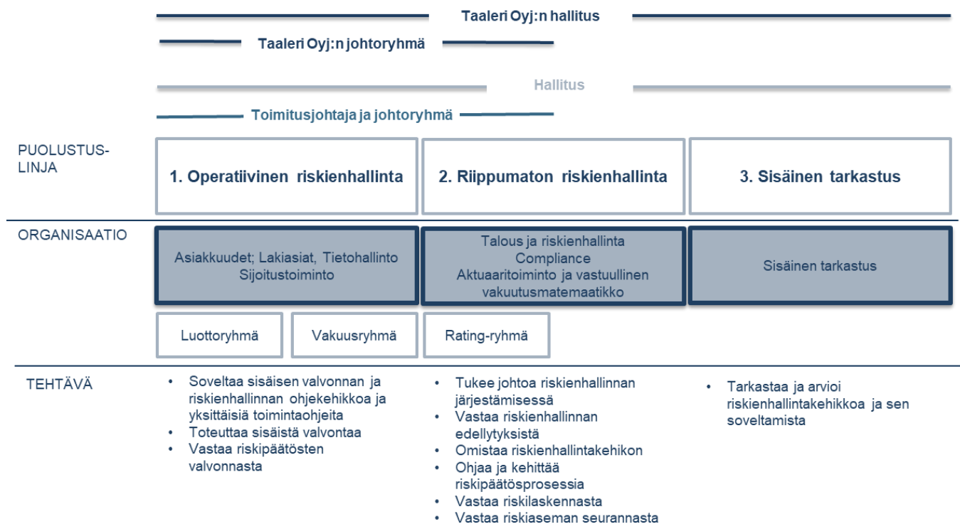
Kuva 4: Garantian sisäisen valvonnan ja riskienhallinnan puolustuslinjat

Yhtiön keskeiset toiminnot ovat Säännösten noudattamista valvova toiminto (compliance), Talous ja riskienhallinta - yksikön Riskienhallintatoiminto, Sisäinen tarkastus sekä Aktuaaritoiminto ja vastuullinen vakuutusmatemaatikko. Sisäisen tarkastuksen tehtävien järjestämisestä vastaava henkilö on yhtiön päälakimies, Aktuaaritoiminnon ja vastuullisen vakuutusmatemaatikon tehtävien järjestämisestä sekä Riskienhallintatoiminnosta vastaava henkilö on talous- ja riskienhallintajohtaja. Säännösten noudattamista valvovan toiminnon järjestämisestä vastaa yhtiön lakimies. Kukin keskeinen toiminto raportoi yhtiön hallitukselle sisäisen valvonnan ja riskienhallinnan toimintaperiaatteissa kuvatulla tavalla.