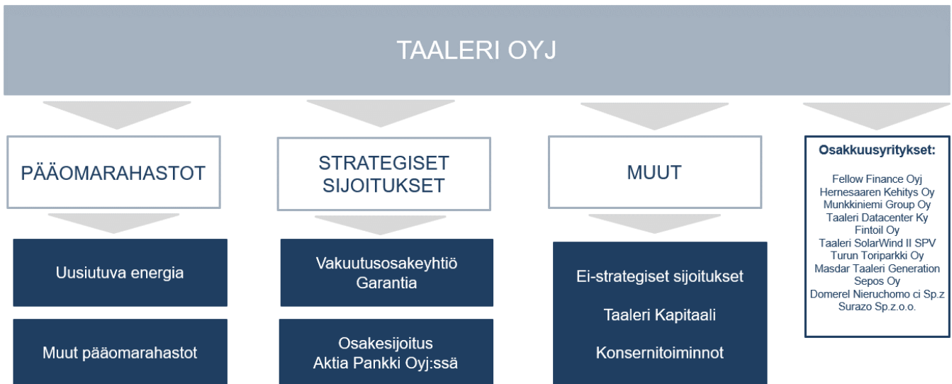
Kuva 1: Taaleri-konsernin rakenne 31.12.2022

Taaleri Oyj tytäri- ja osakkuusyhtiöineen muodostaa vakuutusyhtiölain 26 luvun mukaisen vakuutusyrittäjäryhmän, johon sovelletaan ryhmävalvontaa. Ryhmän emoyhteisönä toimii Taaleri Oyj. Vakuutusyrittäjäryhmälle ei ole asetettu vakavaraisuuspääomavaatimusta.